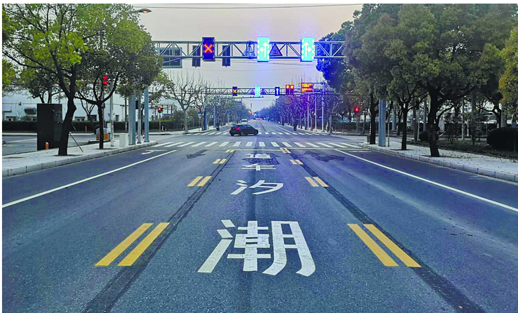
松江区美能达路-江田东路可变车道(潮汐车道)实施后，行车速度大幅提高。