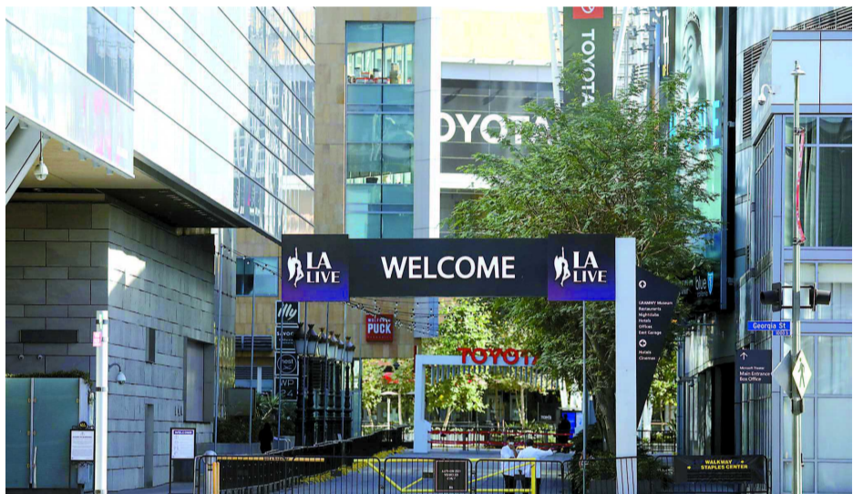
加州城市街道上行人稀少