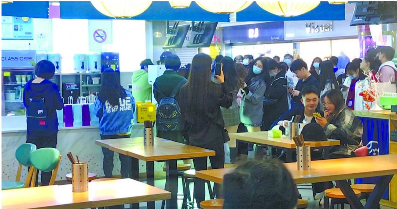
一名身着黑西装女子不断举着手机, 从不同角度反复拍摄排队画面。

随后, 记者又和其他兼职者一起, 被拉到了人民广场的空地上拍集体照。一位资深兼职者悄悄透露, 结束后