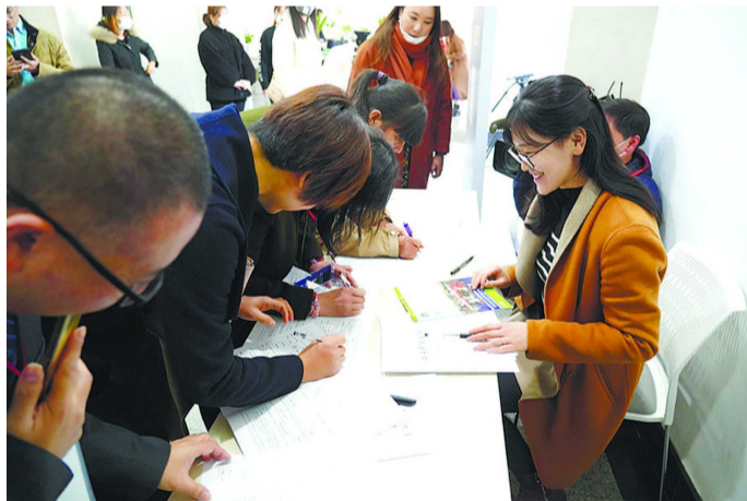
家政本科预报名现场

更多的家政从业人员培养成大学本科生。上海开放大学2021年春季将开设家政学本科专业，这是继2014年开办家政服务与管理专科专业以来的上海首个家政学本科院校，也是全国第一所开设家政学本科的成人高校。