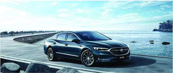
车体的巧妙设计,彰显豪华气质。

可以发现,君越之所以能够始终保持优越的产品力,正是源于其对每一个细节的重视。外观方面,君越灵动感、优雅与现代感于一身,借鉴了别克Avenir与Avista概念车的设计理念,结合运动型车和高档轿车的美学元素,通过长车头、短前悬、宽