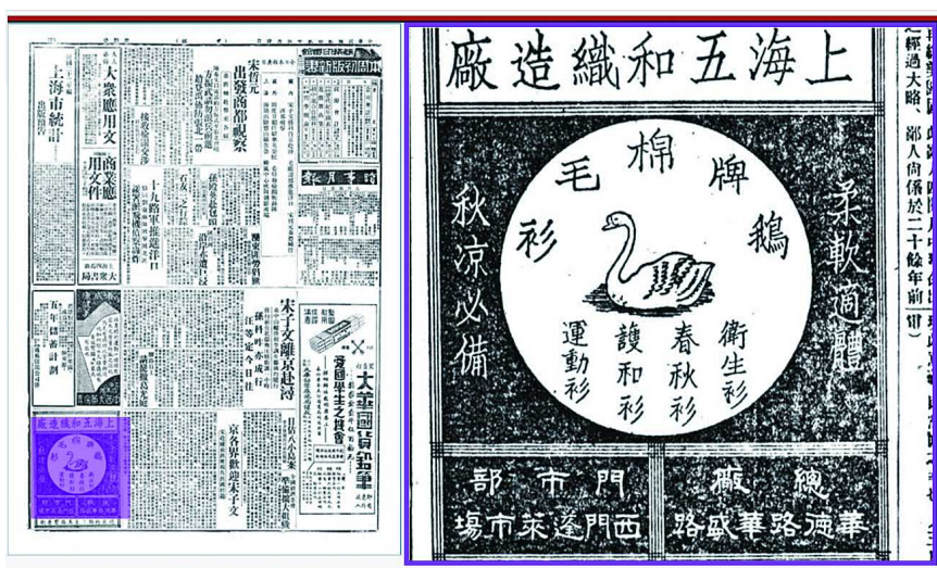
1933 年 9 月 4 日，《申报》上的鹅牌广告。