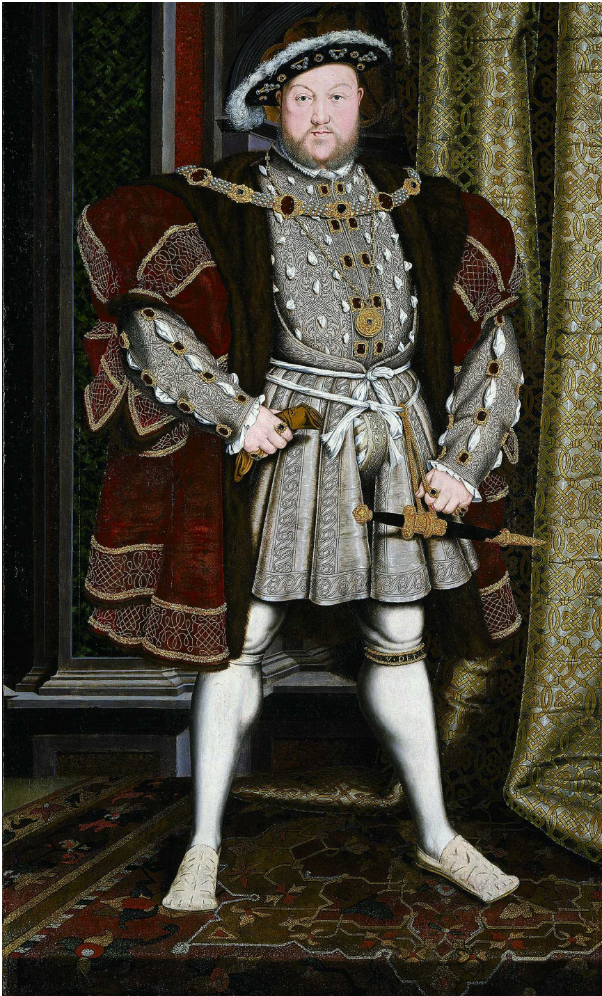
白色紧身马裤是亨利八世喜爱的装束