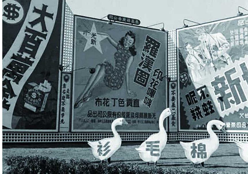
上世纪 40 年代，南京西路仙乐斯附近鹅牌棉毛衫户外广告。