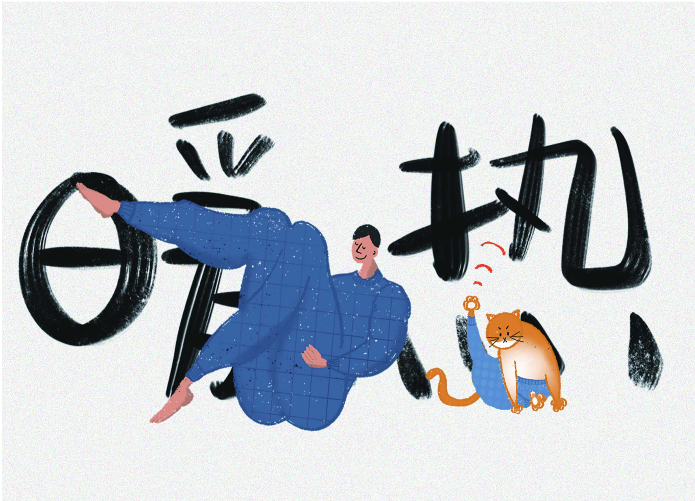
棉毛裤这样物事在上海人的生活中司空见惯。