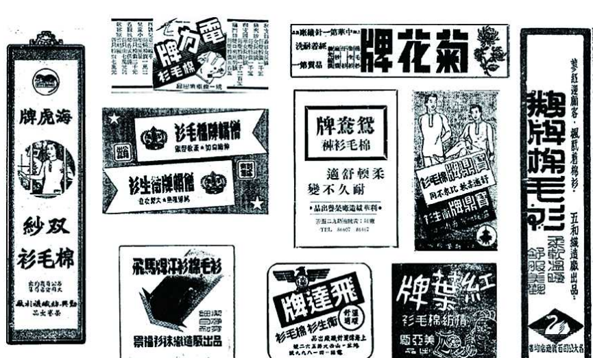
上世纪三四十年代，上海报刊上各种品牌的棉毛衫裤广告。