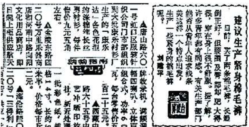
1985 年 3 月 15 日，《新民晚报》刊登读者建议（右图）生产紧身棉毛裤。