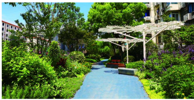
供居民休憩的绿化道

此外,在原佳程广场位置留存的施工围墙,存在一定的安全隐患。为此,街道委托区绿化市容局特别设计了沿围墙花坛,并栽种开