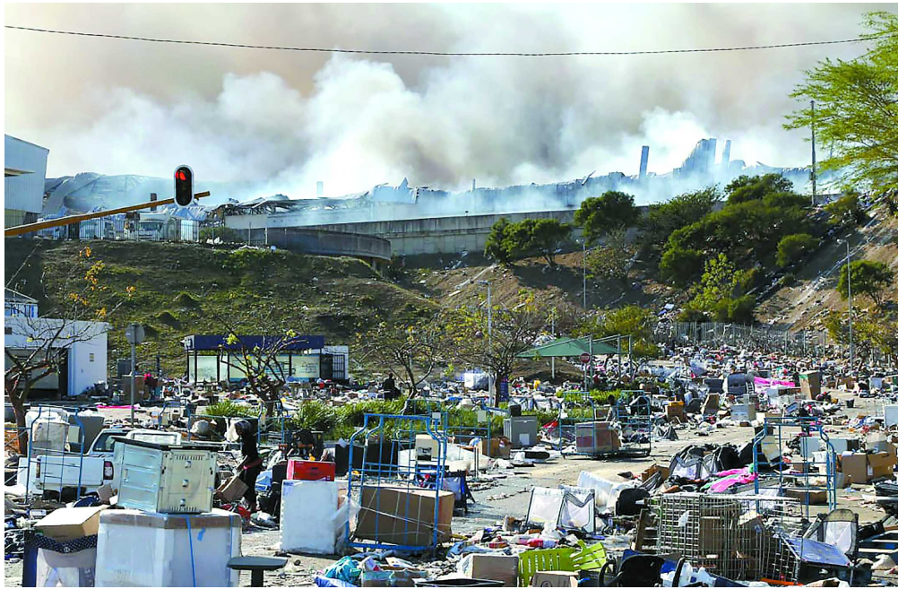
7月14日,南非骚乱持续,德班郊区一工厂失火。