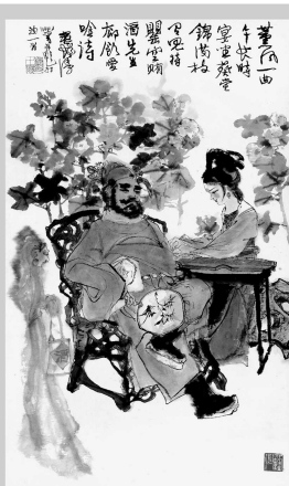
程十发《钟进士听琴图》 100 x 58cm