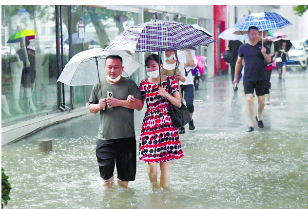
郑州市民涉水前行