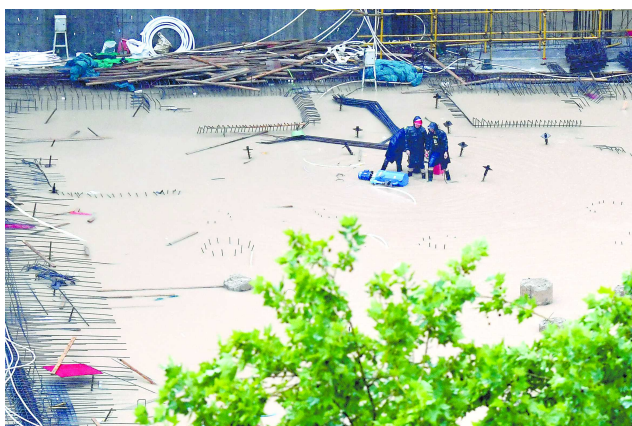
工作人员在郑州市一建筑工地排水