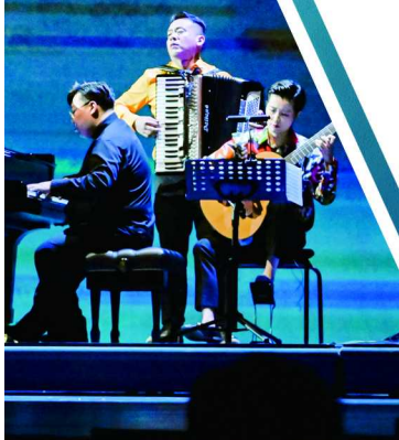
制图 / 潘文健

除了《美术馆奇幻夜》之外，东艺近两个月的舞蹈演出如杨丽萍《十面埋伏》、胡沈员《流浪》都颇受欢迎，作为一门剧场艺术，舞蹈项目如此受欢迎是什么原因？这其中，离不开综艺节目的推波助澜。“能有不同媒介不同平台推广舞蹈，是好事，但我觉得，优秀的舞者还是用作品说话，最顶级的舞台还是在现场。”谭元元说。