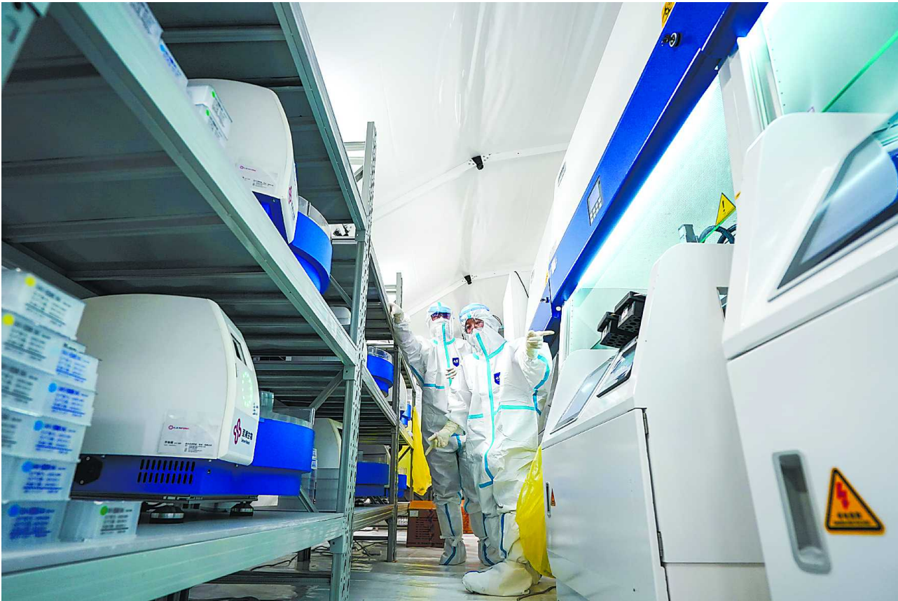
27日，在位于南京青奥体育公园体育馆内的“猎鹰号”气膜实验室，工作人员在进行核酸提取作业。

专家提醒：当前疫情形势严峻复杂，防控不能放松。要时刻保持个人防护意识，坚持勤洗手、戴口罩等良好的个人卫生习惯。一旦出现发热、干咳、乏力、鼻塞、流涕、咽痛、嗅觉味觉减退、结膜炎、肌痛和腹泻等症状，立即到就近的发热门诊就诊，并主动告知14天活动轨迹及接触史。