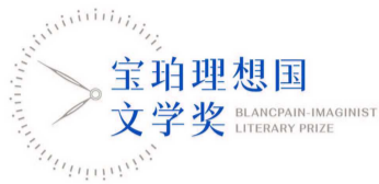
宝珀理想国文学奖全新LOGO

2021年第四届宝珀理想国文学奖初选名单今日公布,11位青年作家的作品入围。本年度报名作品数量再创新高,由阿来、格非、李宗盛、梁鸿、马家辉组成的当届评委会经数月悉心审阅,各有所爱,于今日正式公布入围初名单。宝珀理想国文学奖的设立,是为了让大众真正感受到“读书,让时间更有价值”。9月15日,文学奖评奖办公室将依据评委多数表决出的作品,公布最终入围决选名单的5部作品。