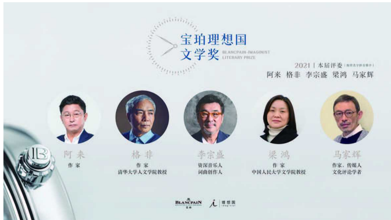
2021第四届宝珀理想国文学奖评委会

精妙飘忽的语言和各种别出心裁相互生发,相互辉映,令人称叹。很好地把知识与生活、感情与理性、想象力和准确性结合于一体的小说,开拓了小说的某一空间。