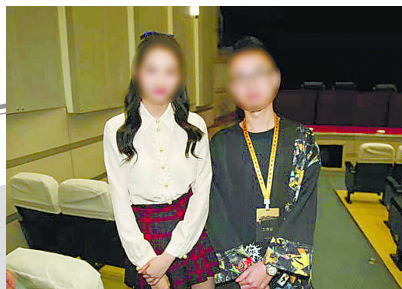
林某“美业百科”页面展示的和明星合影