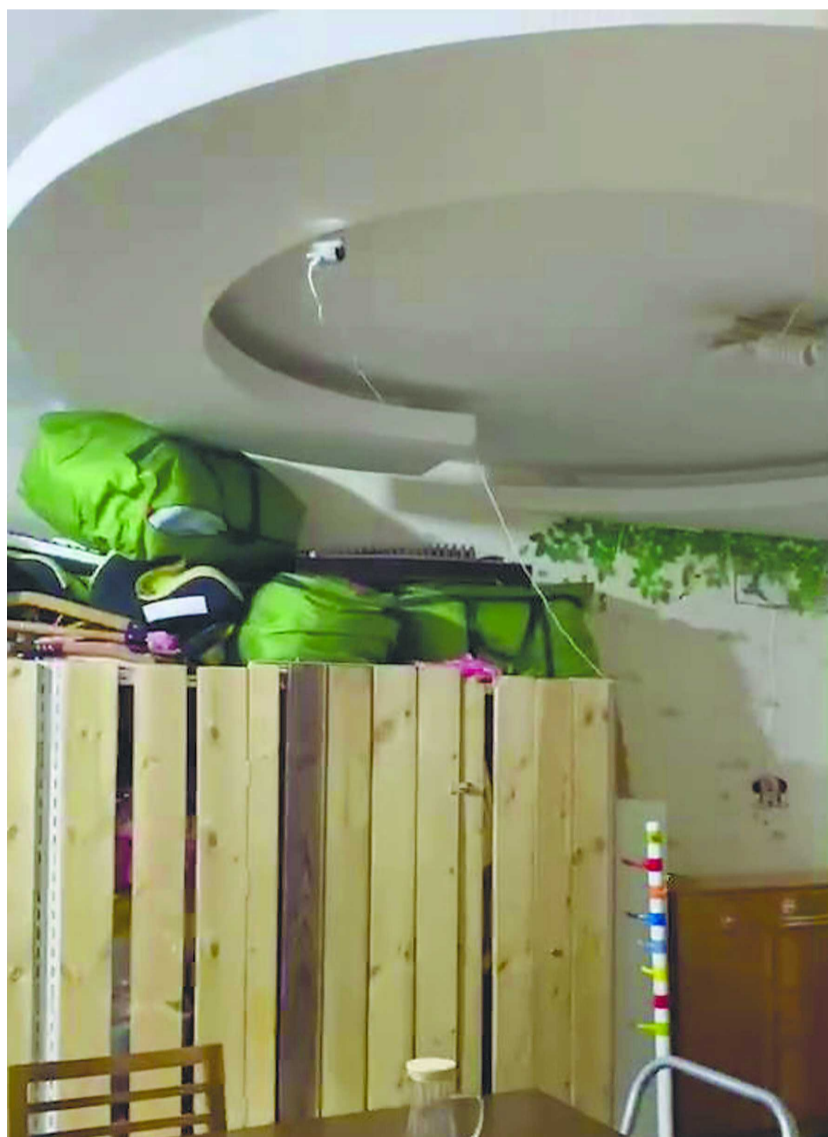
摄像头悬挂在客厅吊顶附近(视频截图)