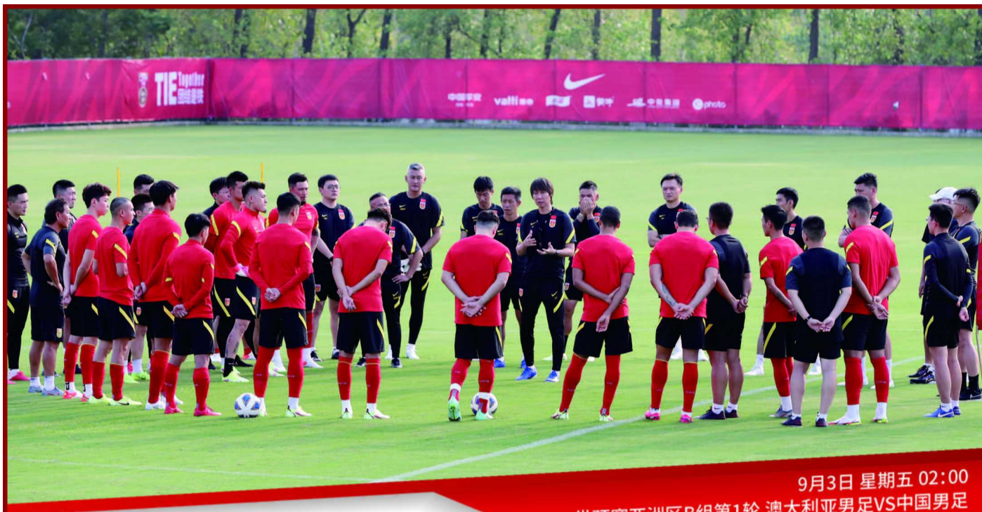
9月3日 星期五 02:00 世预赛亚洲区B组第1轮 澳大利亚男足VS中国男足