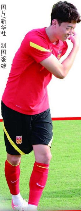
制图/张继

李铁上任后,带领中国队在40强赛中克服失去主场的困难,展现出良好的精神面貌,最终顺利晋级。进入12强赛,国足无疑将面临更大的困难和挑战。首场比赛面对强敌,无论顺利与否,希望中国队的球员们都能继续顽强拼搏,用积极的比赛风貌回馈广大球迷,力争取得“开门红”。