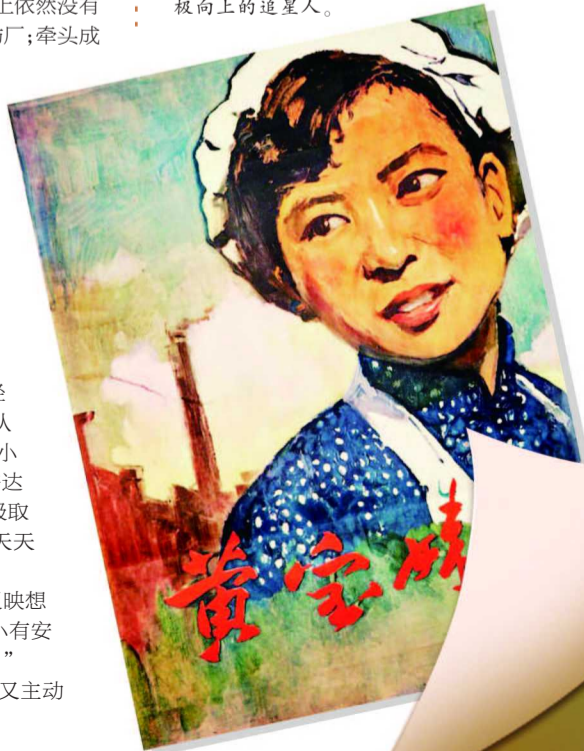
电影《黄宝妹》海报资料图片

为这样的“明星”和“粉丝”关系点赞！在以“清朗”为名、整治“饭圈”乱象如火如荼的当下，希望更多粉丝关注明星们的作品，关注他们的“人生故事和道德风采”，从而推动打造一个清朗洁净的“星空”，一群积极向上、追星的人。