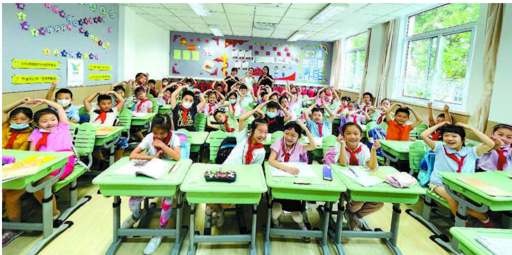
高安路一小的孩子们