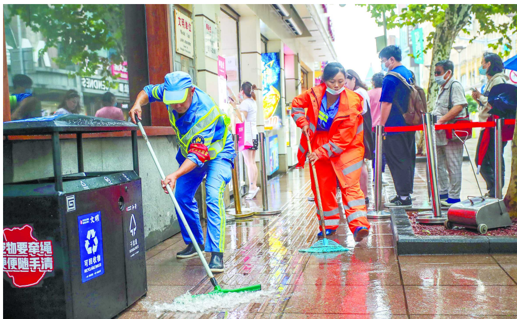
9月14日上午,南京路步行街上保洁工在清扫路面积水。