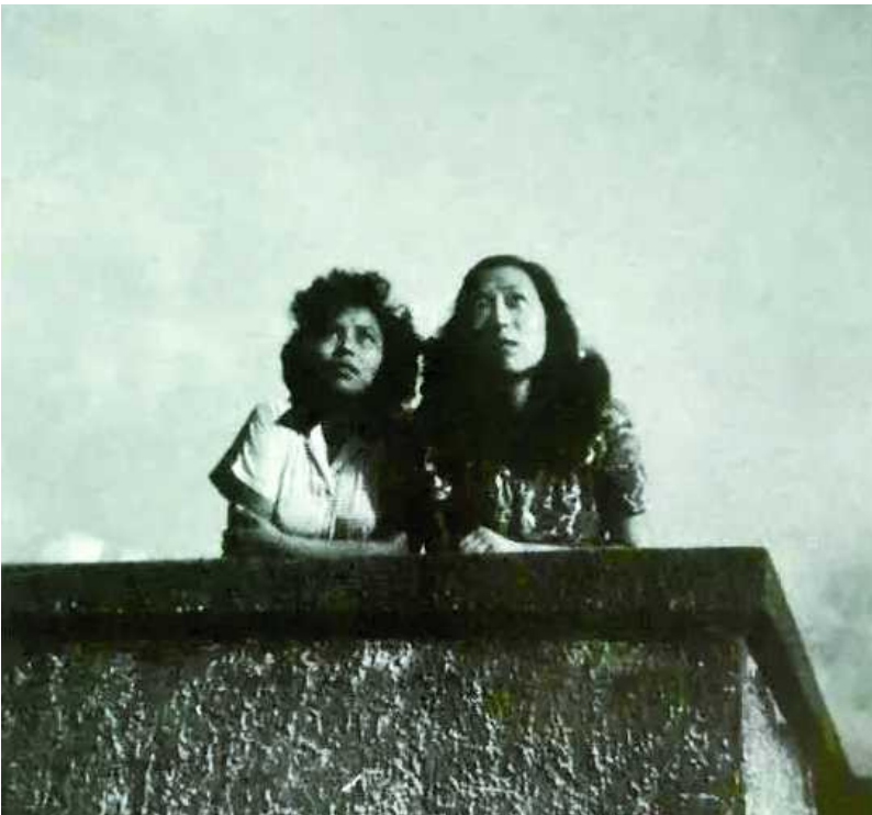
张爱玲(右)和好友炎樱在阳台上合影

在常德公寓,她写下了一生中最重要的几部小说。《沉香屑第一炉香》、《沉香屑第二炉香》、《心经》、《倾城之恋》、《金锁记》、《红玫瑰与白玫瑰》、《桂花蒸 阿小悲秋》……这几部作品里都有阳台的“戏份”。也许有些情节,就是她置身于阳台时构思出来的。然而在今天的上海,作家要在阳台上获取写作灵感,恐怕就没那么容易了。还有什么像意大利人一样跟邻居在各自的阳台上合奏高歌一曲。像法国人一样在阳台上来杯咖啡喝喝。这些“骚操作”在上海基本想也不要想。因为客观条件已经被我们“封”死了。除了少数像常德公寓这样的历史建筑还保持着敞开式的阳台,在上海街头抬头仰望,