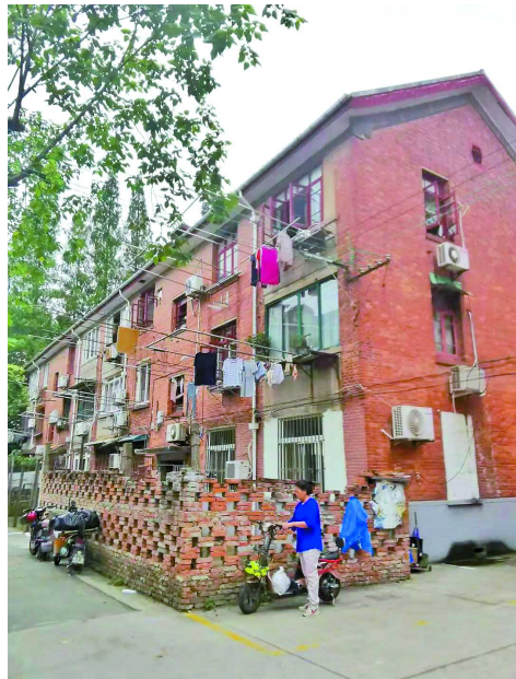
谈凯敏家当年住的小区內阳台面积比较大