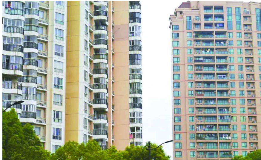
天山河畔花园(左)和仁恒河滨花园一个可以封阳台一个不可以封阳台