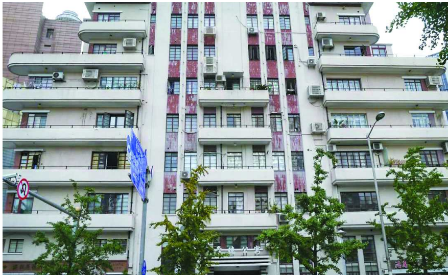
常德公寓至今仍是敞开式的阳台这在今天的上海并不多见