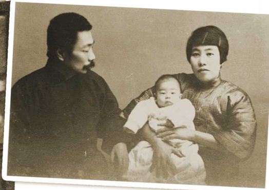
▲周海婴出生100天的全家合影