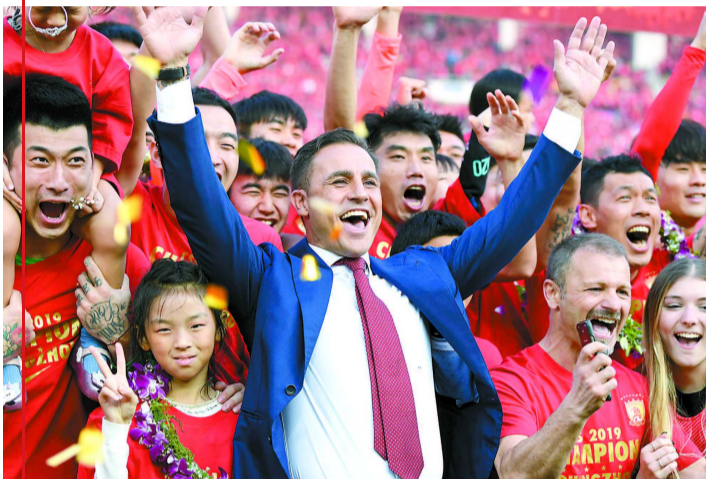
2019年12月1日,卡纳瓦罗(中)与广州队球员在赛后的庆祝仪式上。