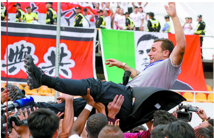
2017年11月4日,天津权健队球员将主教练卡纳瓦罗(上)抛起庆祝。

那么谁将会是卡纳瓦罗的接替者?目前来看最有可能的是本赛季已经进入教练组但依旧身兼球员的41岁老将郑智。如果可能的话,郑智将率领广州队征战下个月开始的足协杯,以及12月进行的中超第二阶段争冠组比赛。