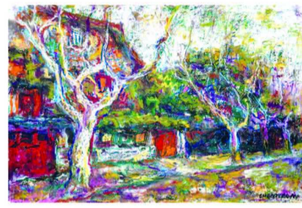
谌孝安《思南路周公馆》

此次展览由上海久事美术馆、上海粉画艺术创作沙龙主办，上海久事文化传播有限公司承办。据悉，展览将举办至10月26日。