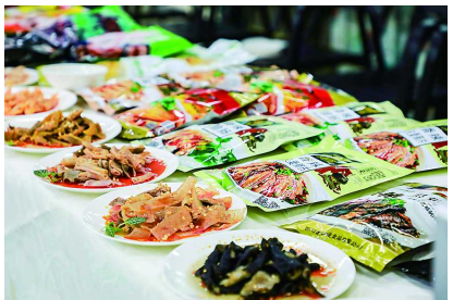
纵观我国冷冻食品五十多年的发展历史

，至今冻品已占据了食品需求的半壁江山。近几年，随着国民经济的快速发展，消费者对于优质食材的需求与日俱增，也使冻品行业的市场前景变得更为广阔。作为上海农批市场的先行者——江杨农产品市场积极为冻品产业发展引新模式。近日，江杨“冻”季食材推荐会在上海江杨农产品批发市场举行，由此拉开了为期三天的江杨消费日活动的序幕。此次活动由江杨农产品批发市场联手上海商情共同举办，邀请了上海知名餐饮主理人、主厨、生鲜电商、零售生鲜采购等出