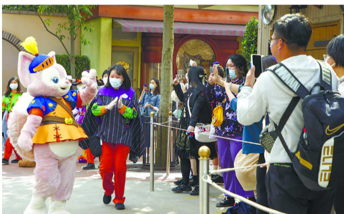
上海迪士尼乐园昨起恢复开放

自去年因疫情关闭100天重新开放以后,迪士尼乐园的入口、各游乐项目排队等候区、商店收银区、餐厅收银区、户外表演区等处多了黄色一米线、黄色安全框等安全距离提示标识,记者昨天看到,这些标识至今依然在。