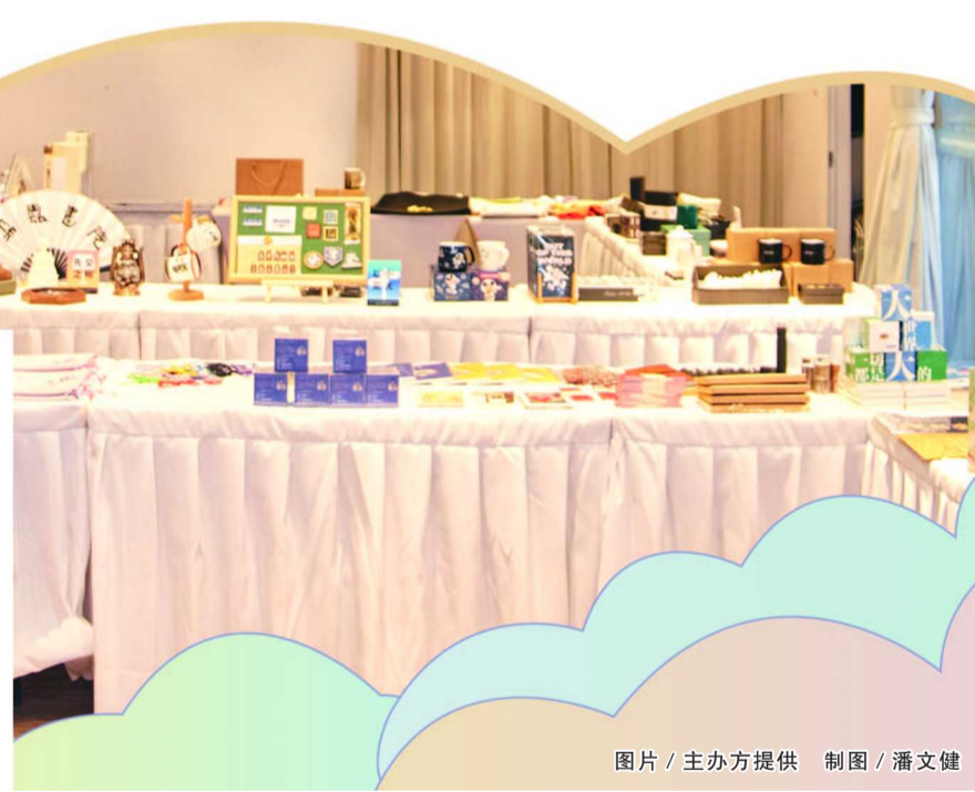
制图 / 潘文健