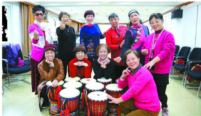
“抗癌鼓队”展示不一样的精神面貌

这是一群抗癌明星,也是一曲凡人之歌。她们不是什么流量网红,也没有什么闪光灯,她们是一支特殊的“抗癌鼓队”。每一次击打,于身患乳腺癌的她们而言,是一种康复训练,同时也是对命运的顽强回击。在生活的舞台上,这支鼓队如何长成了今天的样貌?她们给出的答案是:不以外界为镜子,而以内心为标准,用勇气去重塑自身。