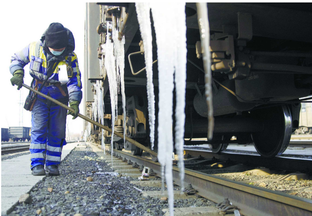
新一轮暴雪将至,黑龙江积极准备应对极端天气。21日,在鸡西站西场,工作人员在车辆进站后固定车体。