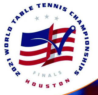
制图/张继