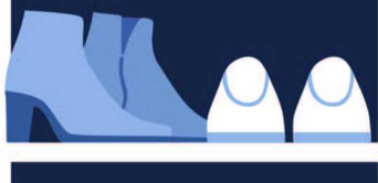
制图 / 潘文健