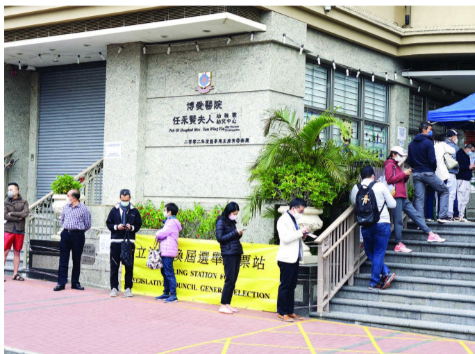
19日,在位于香港黄埔的投票站,选民在排队准备投票。

香港特区行政长官林郑月娥9时在位于罗便臣道的高主教书院票站完成投票。林郑月娥对记者表示,此次是完善香港特区选举制度后的首次立法会选举,意义重大。“希望广大选民踊跃投票,及时履行公民责任,行使选举权,更重要的是为完善后的特区选举制度和香港的未来投下具有信心的一