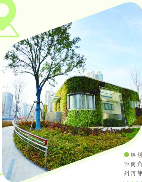
苏州河畔锦绣花园

●锦绣花园位于静安区光复路长安路交叉口,天目路西南角,苏州河长寿路桥南侧,总面积4359平方米,是苏州河静安段贯通的六大节点之一。