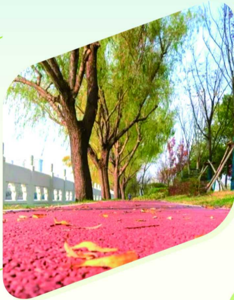
松江光星滨河公园