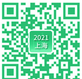
长按二维码 查上海城市人群“体检大考成绩单”