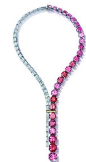
童瑶佩戴蒂芙尼铂金及 18K 黄金镶嵌多彩碧玺及钻石项链