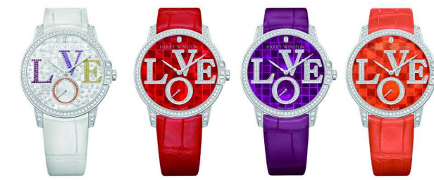
Midnight 系列 Winston With Love 腕表