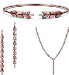
宋轶佩戴蒂芙尼 Victoria® 系列镶钻作品