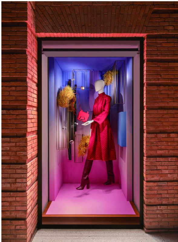
配饰橱窗中，天空之城的居民精心准备礼物，赠予陆地与海洋中的同伴

位于上海“爱马仕之家”正门左侧的圣诞亮灯艺术装置，将织物与镜面有机结合，共庆欢乐时光。城市光影编织其中，夺目绽放。