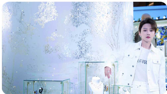
DIOR 迪奥中国品牌大使刘雨昕探索上海恒隆广场限时精品店