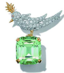
龚俊佩戴蒂芙尼 Schlumberger® 高级珠宝系列

青年演员宋轶佩戴蒂芙尼 Victoria® 系列镶钻作品于耳畔及腕间摇曳生姿，藤蔓造型彰显旖旎之美，熠熠钻石闪烁着悦动光芒，彰显灵动迷人风采。