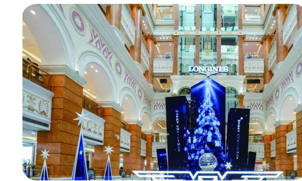
浪琴表上海环球港直营店

浪琴表优雅形象大使彭于晏佩戴名匠系列腕表现身，也倾情推荐了心目中的时间礼物：“我手上佩戴的浪琴表名匠系列月相腕表，它的设计非常简约、经典，既适合休闲穿搭，也可搭配正装出席正式场合，充满质感。表盘上设有月相显示窗，就好像把月亮戴在腕间，见证你和 TA 的每一刻优雅时光。” 名匠系列承继浪琴表的精纯制表工艺，银色麦粒纹饰表盘搭配阿拉伯数字时标，诠释经典风格；搭配精钢表链，提供舒适的佩戴体验。全系列搭载机械机芯，支持月相、日历等多重功能，彰显严谨精湛的制表工艺。