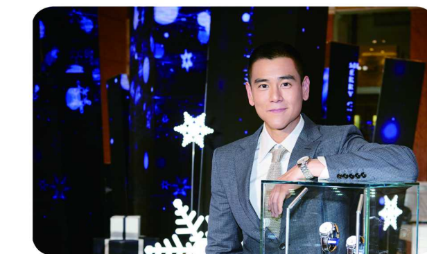
浪琴表携手彭于晏莅临上海环球港直营店，点亮时光许愿树