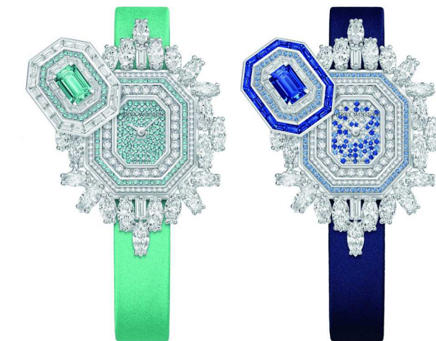
Ultimate Emerald Signature 高级珠宝腕表