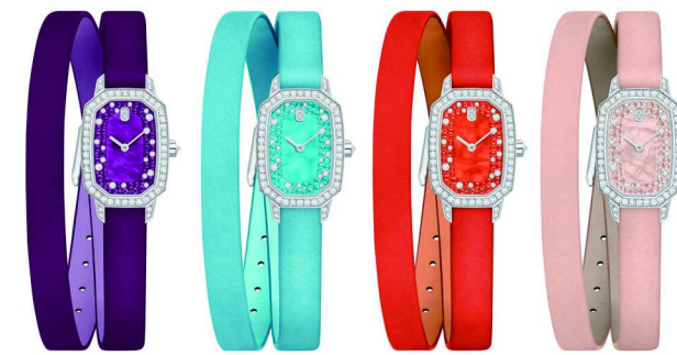
全新配色的 Emerald 系列腕表

同样为今年全新推出的海瑞温斯顿 Midnight 系列 Winston With Love 腕表则用缤纷的暖色来诠释不同的爱情阶段，以此通往爱之秘境。