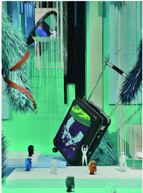
男性橱窗中，海洋生物、人类与自然和谐共栖，于蓝色海洋中随性漫游