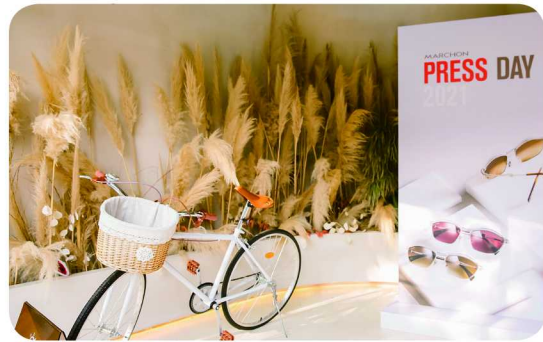
Marchon 迈创集团 2021 全新秋冬系列预览

NIKE 以轻巧材质和舒适设计，将专业运动精神坚持到底。CONVERSE 经典元素巧妙点缀，时髦色彩和镜框廓形重塑街头定义，创造专属街头青年的难忘记忆。菲格拉慕将风雅态度和精湛工艺完美融合，新晋菲格拉慕眼镜全球品牌代言人欧阳娜娜演绎活力新生的经典设计。CALVIN KLEIN 一以贯之的极简主义，带来高级摩登的视觉印象。