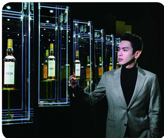
张若昀在“珍稀年份系列”藏品前感受时光沉淀

久负盛名的苏格兰单一麦芽威士忌品牌麦卡伦，在上海当代艺术馆开启品牌全球范围内首次艺术大展——“醇境之源——麦卡伦艺术体验展”。麦卡伦品牌携手多位知名艺术家联袂打造的这场全感官沉浸式艺术盛宴，以“起源”、“精神”、“展望”三大篇章，引领观者探究麦卡伦品牌的精神本源。灵感激荡的艺术作品，多层次的沉浸式互动体验，珍稀稀有的威士忌藏品……“醇境之源——麦卡伦艺术体验展”的精美恢弘，也吸引到实力派演员张若昀、辛芷蕾前来先行体验，并留下极具个人风格的独家展前攻略。