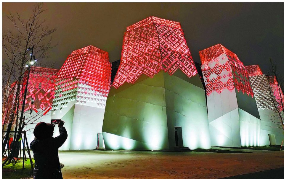
原俄罗斯馆夜景灯光秀

此外,节日期间,各大商业企业还纷纷引进表演精彩、形式新颖的艺术节目,提升消费者美好生活品质。