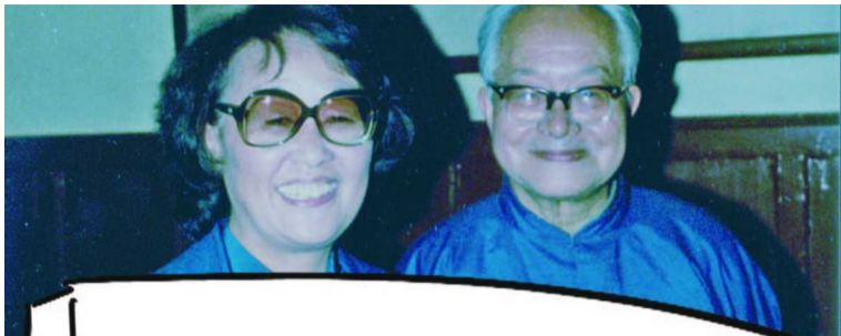
1980年4月6日，沈从文在家中接待聂华苓