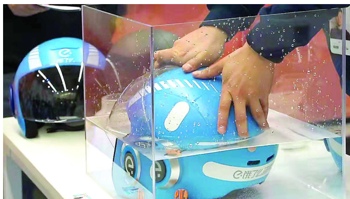
智能头盔防水性优良,不怕雨水。

罩,头盔镜片容易起雾,会影响视线。通过在镜面上做一个纳米涂层,无论是遇到雨天,还是冷热交替,镜片再也不会升起一团白茫茫的雾气。”