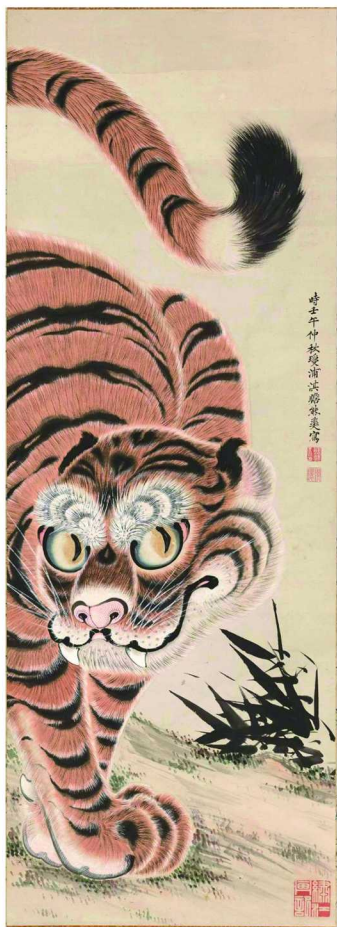
熊斐 虎图 1792年