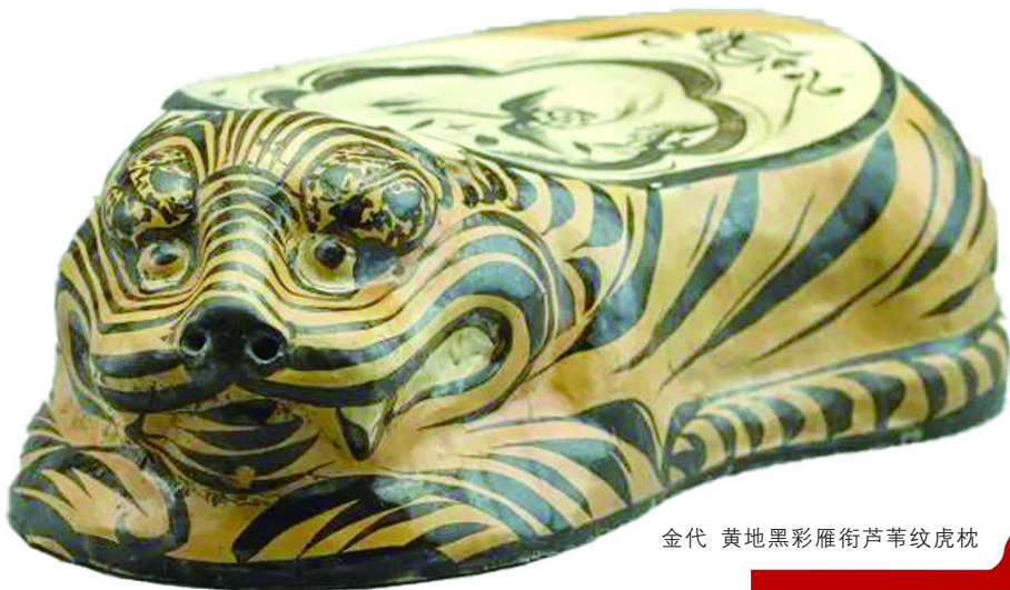
金代 黄地黑彩雁衔芦苇纹虎枕

上海博物馆三楼中国历代绘画馆也配合此次展览展出馆藏元代佚名《白描群仙图卷》。作品以白描手法绘制神仙人物九组,第五组中几个仙风道骨的人物之外,还有一头老虎,其个头远远小于人类,毫毛匀密,情态可掬,似乎不是威风凛凛的百兽之王,而变成了一头萌宠。