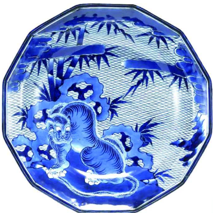
19世纪 日本有田窑 青花虎竹图十二角形盘

在上博一楼大厅展出的5件文物,分别是上海博物馆馆藏的金代黄地黑彩雁衔芦苇纹虎枕、西汉鎏金虎镇与金代秋山玉饰,以及来自日本九州国立博物馆的19世纪青花虎竹图十二角形盘与青花虎竹纹大盘。