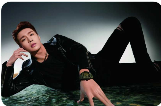
HUBLOT 宇舶表新晋品牌大使张艺兴

瑞士奢华制表品牌 HUBLOT 宇舶表秉承“敢为先锋，独树一帜，与众不同”的品牌精神，以其颠覆性的卓越材质与先锋创意，不断突破制表工艺疆域，锻造出风格大胆前卫的时计臻品。近日，HUBLOT 宇舶表再度创新性地融合机械美学与高科技材质，推出全新限量版 BIG BANG 灵魂绿色碳纤维迷彩腕表，将“融合的艺术”提升至全新高度。新品发布当日，宇舶表更隆重宣布全能艺人张艺兴正式成为宇舶表品牌大使。