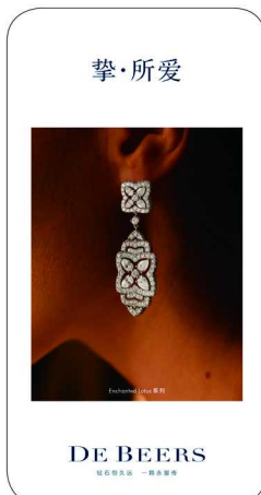
戴比尔斯发起“我可以”全球宣传造势活动