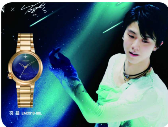
西铁城 x 羽生结弦签名款“羽昼”上市

西铁城推出羽生结弦第三款签名腕表“羽昼”。该款腕表的灵感源自将一切都化成命运馈赠的羽衣，如极昼般持久光明，照亮更远大世界的路。腕表表盘以考斯滕“九仙”的极光色为基调，描绘出宇宙的神秘与宏大。玫瑰金色表壳、表带象征载入史册的光辉表演，藏于表壳内面的金色星图完整标记了羽生结弦史诗般的金满贯之路。表底还采用了羽生结弦手书的汉字签刻，作为给中国粉丝的限定心意。腕表的设计也处处与羽生结弦有关：位于表壳左侧的表冠镶嵌有坦桑石，是12月的诞生石；表盘12/7点位天然真钻的闪烁星辉，表现羽生结弦生而闪耀的人生；时针与分针的镂空设计，仿佛聚光灯洒下的影子，一如羽生结弦在冰上优雅绽放的步伐。