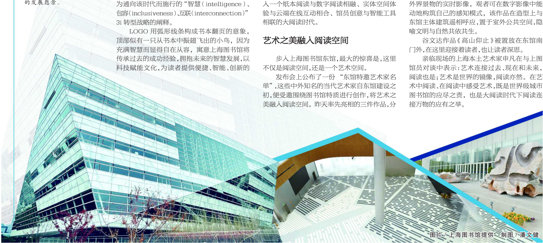
制图 / 潘文健

亲临现场的上海本土艺术家申凡在与上图馆员对谈中表示：艺术连接过去、现在和未来，阅读也是；艺术是世界的镜像，阅读亦然。在艺术中阅读、在阅读中感受艺术，既是世界级城市图书馆的应尽之责，也是大阅读时代下阅读连接万物的应有之举。