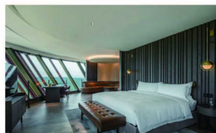
逃牛岭酒庄的客房堪比五星级酒店

说到烟台产区，它正好位于埋土线上，所以这里冬天不用埋土，属于暖温带海洋季风气候，种植和酿造资源很丰富。再缩小范围，蓬莱是烟台产区酒庄聚集程度最高的地域。梁扬推荐，如果只能造访一个国内产区，首选蓬莱丘山谷。它共有7个酒庄，其中瑞岱酒庄因“头顶”拉菲集团的光环最“耀眼”。