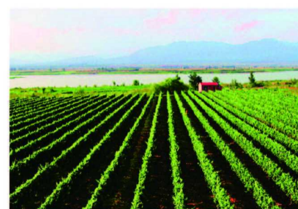
怀来地处北纬40度的葡萄种植黄金地带

王朝的发展和葡萄酒的进程息息相关。1980年，王朝公司酿制出了中国第一瓶全汁干型葡萄酒，弥补了国内空白。2010年，王朝就提出了“新国潮”概念……显然，王朝已经不是你我他原本认识的王朝了。