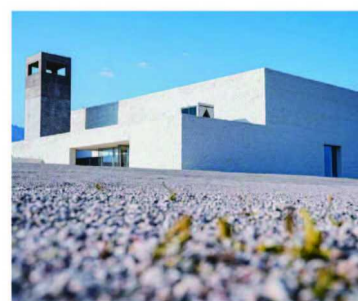
嘉地酒园酒庄犹如一座现代艺术博物馆

宁夏是目前国内精品酒庄最集中的产区，目前有200多个酒庄，宣传力度也很大。特别是贺兰山东麓，在上海中餐厅的酒单上可以轻松点到。因为有着贺兰山这座天然屏障，原本寸草不生的银川有了种植葡萄的条件，它阻隔了沙尘和寒流，形成暖温带干旱气候，干旱少雨，用黄河水灌溉，是业界公认的最适合种植酿酒葡萄和生产高端葡萄酒的黄金地带之一。