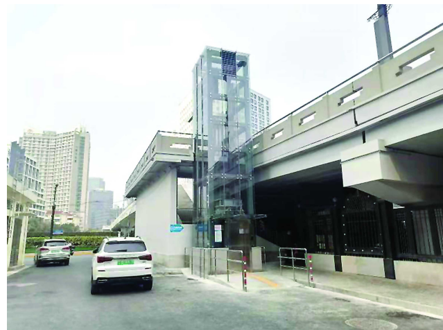
苏州河桥加装电梯第一例