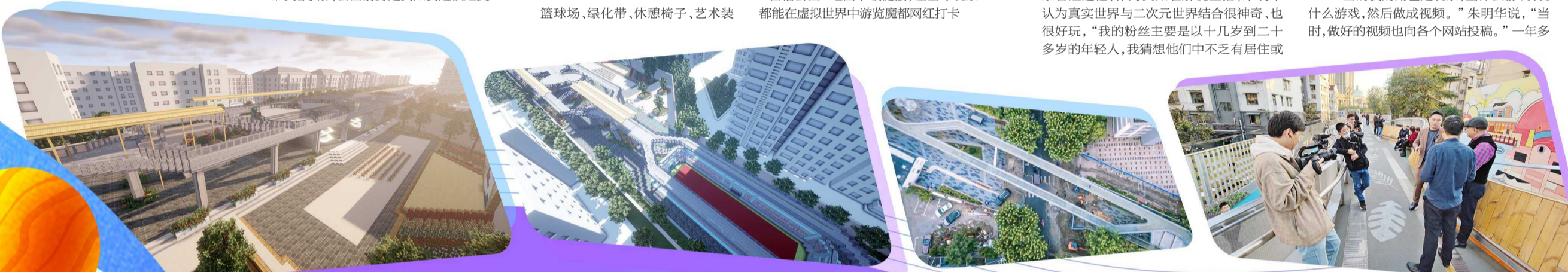
制图 / 潘文健