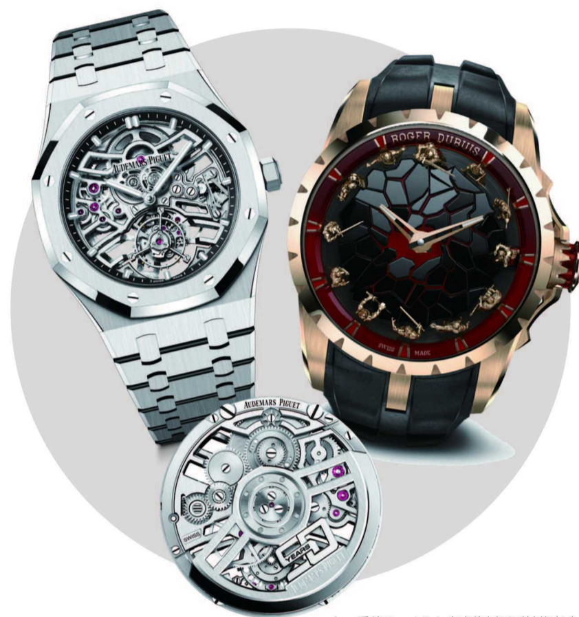
上：爱彼 Royal Oak 皇家橡树系列首款自动上链浮动式陀飞轮镂空腕表

在表壳背面，摆陀经过颠覆性的重新设计，圆形饰面由两层倾斜的金字塔形编织层组成，营造出城堡风格的彩色玻璃外观，由此可以看到马赛克内部的摆陀移动情况，令人着迷。