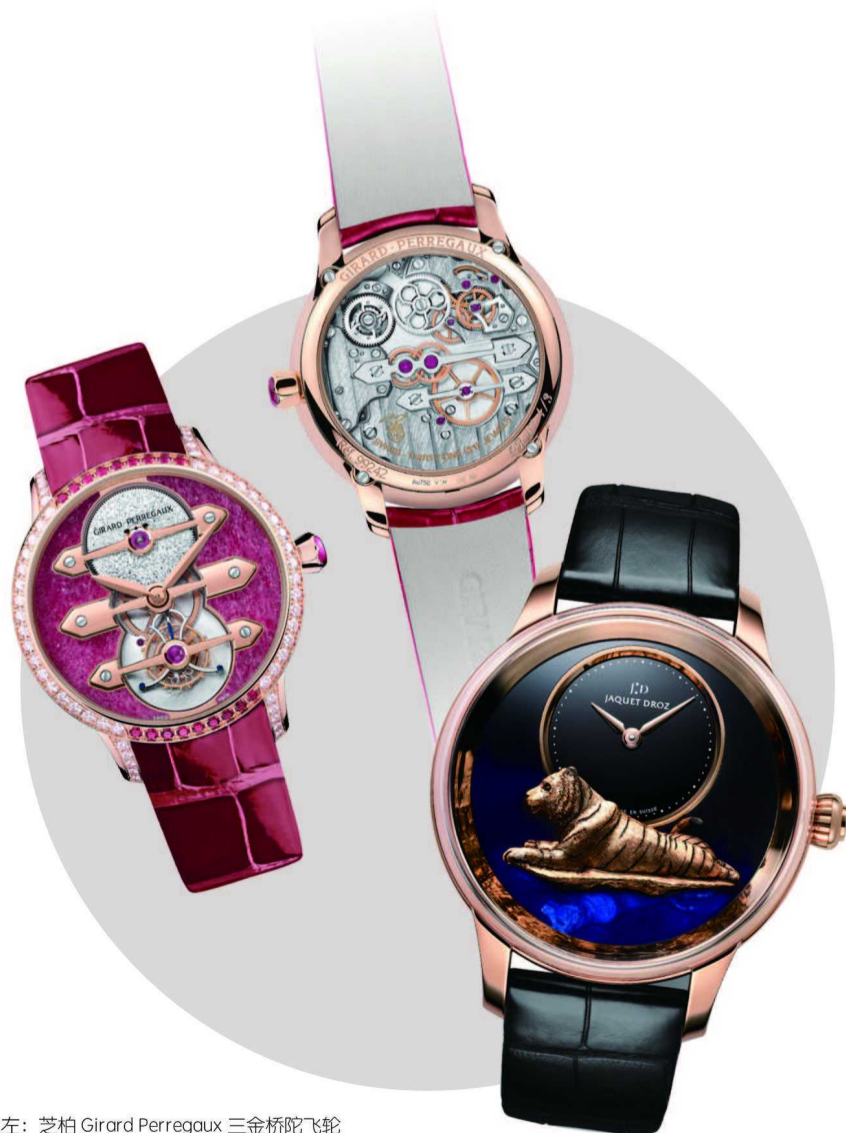
左上：芝柏 Girard Perregaux 三金桥陀飞轮红宝石之心腕表

机芯方面，两枚腕表均配备镶嵌缟玛瑙的金质摆陀，更有一只伏于繁茂枝叶上的老虎装饰其上。