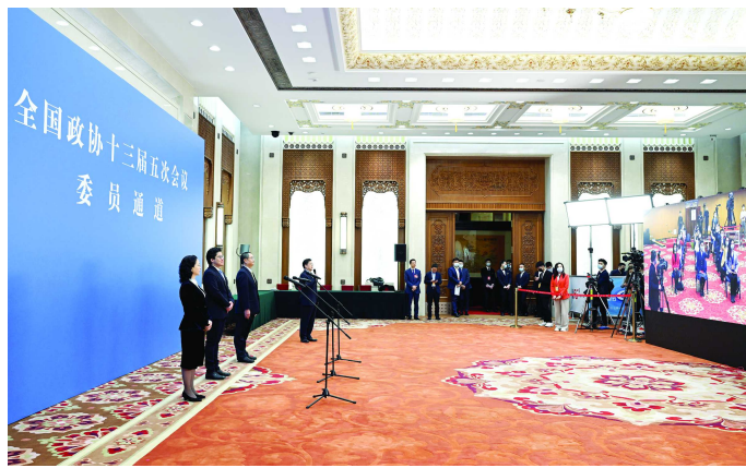
昨日，全国政协十三届五次会议第二场“委员通道”采访活动举行。

“现在入伍的新战友们思想活跃、个性鲜明、科技文化素养高，在大灾大难面前、生死考验面前，个个都能豁得出来、顶得上去。”西西玛铿锵有力地表示，“新时代，我们