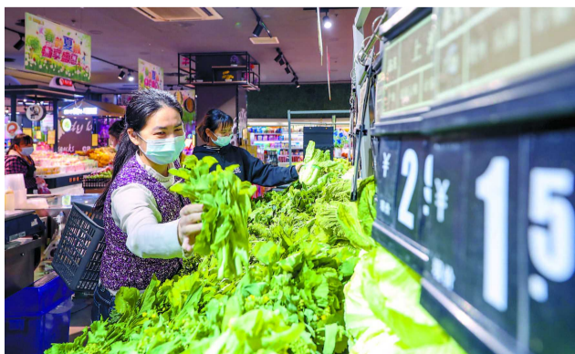
近日,顾客在某超市选购蔬菜。

“我们将紧盯重点大宗商品市场供需和价格走势,加强监测分析研判。”胡祖才说,要做好粮食、能源、重要矿产品等保供稳价工作,加大现货市场联动监管力度,严厉打击捏造散布涨价信息、囤积居奇、哄抬价格等违法违规行为,特别是对资本恶意炒作,将予以坚决打击。