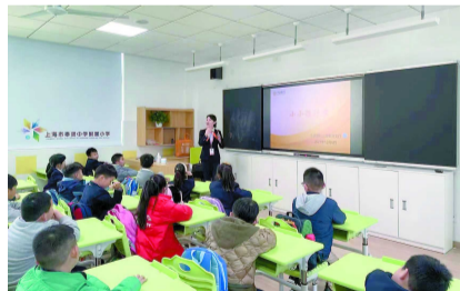
宁波银行上海分行利用寒暑期举行“小小银行家”活动

虹口支行也走进社区,围绕大众对存款保险的关切点,深入开展公益宣传活动。虹口支行组织社区群众学习《存款保险条