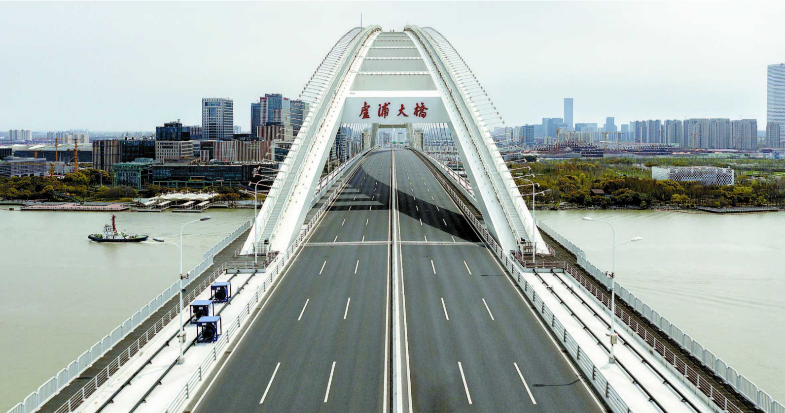
2022年3月28日,上海以黄浦江为界开启新一轮核酸筛查,市民积极配合防疫措施,足不出户,卢浦大桥上很少看到车辆通行。