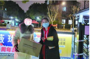
上图：“太平守护者”为客户送上新鲜蔬菜

为积极应对疫情，太平人寿上海分公司迅速反应，推出“太平守沪 为爱加油”客户关爱计划。公司与沪上知名果蔬种植基地合作，将新鲜采摘的蔬果，由持有48小时内核酸检测阴性证明的太平保险代理人，为客户朋友直送送达。 太平人寿代理人，纷纷化身“太平守沪”者，为疫情封控中的广大客户雪中送炭，切实解决了抢菜难的问题。据悉，活动推出至今，已有上百位客户收到了“太平守护者”送上的暖心慰问，越来越多的客户感受到了太平人的温暖。