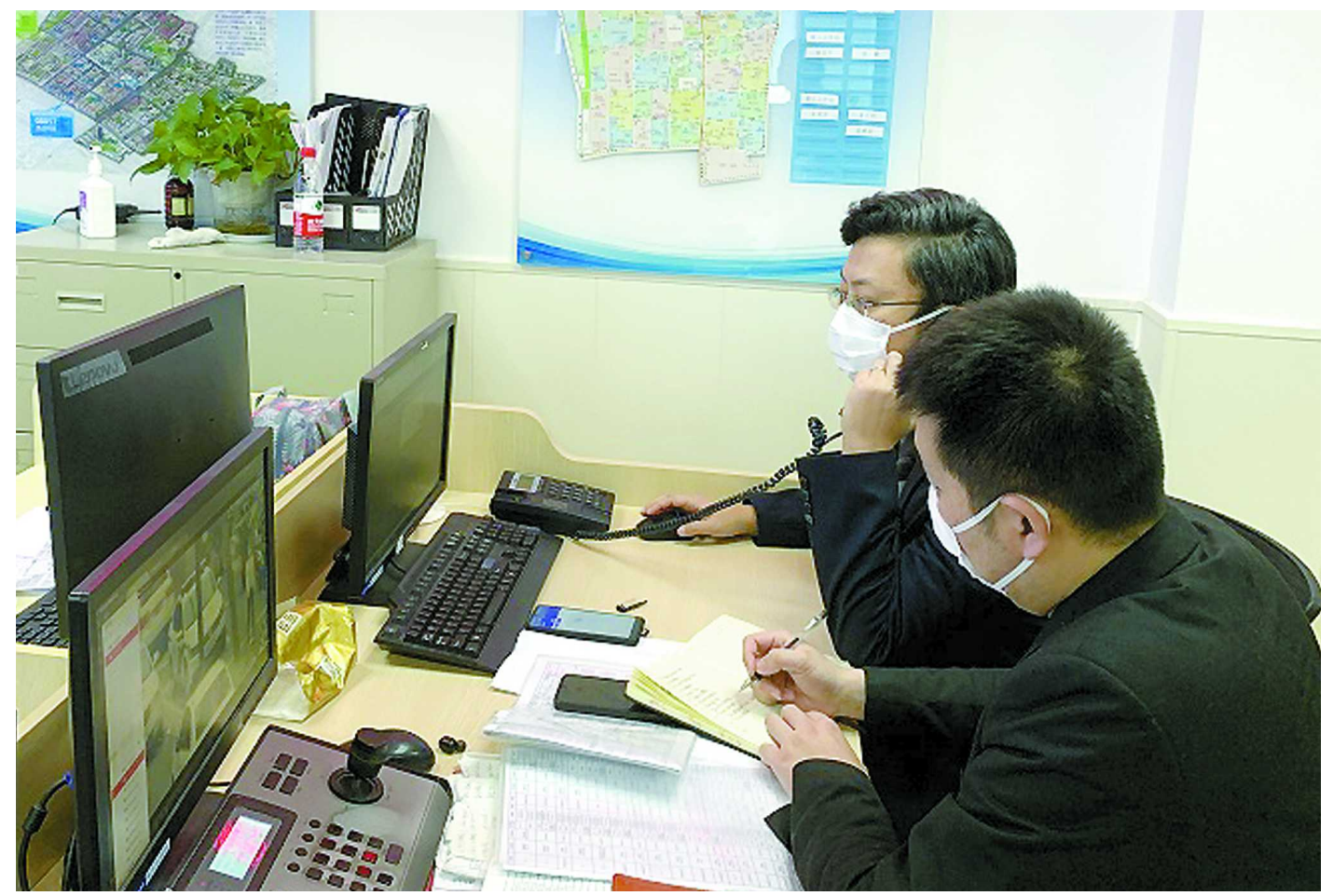
热线电话是4个工作人员“2+2”轮岗