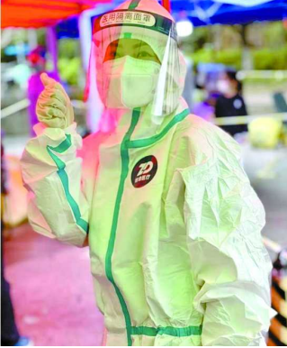
上图：太平人寿代理人作为志愿者参与社区服务工作

尽管防疫志愿服务可能存在风险，但太平志愿者们们仍然默默坚守，进一步筑牢社区防疫屏障。