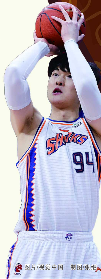
制图/张继

本赛季季后赛将于4月1日开战。首日比赛中,广东队将对阵天津队,龙狮队将对阵山西队。