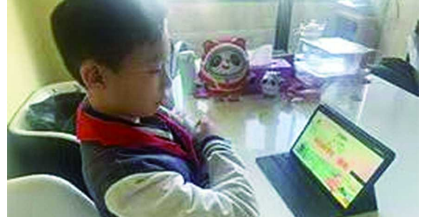
妙的排版,制作成图文并茂的手抄报作品,弘扬民族精神,表达战“疫”必胜的信心。

正值疫情防控关键时期,三、四、五年级的队员们用图文并茂的手抄报表达自己对特殊时期的清明节的理解。他们搜集有关清明节的历史起源,认真阅读革命烈士的故事、诗篇,搜集与抗击疫情有关的防护知识、感动时刻等,用优美的文字、精湛的画艺、巧